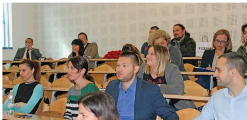
Kolokvij Znanstvenog centra izvrsnosti za školsku efektivnost i menadžment

Želeći pomoći mladim znanstvenicima u postizanju međunarodne vidljivosti hrvatskih društveno-humanističkih znanosti, na sveučilištima u Zadru i Splitu održani su istraživački kolokviji