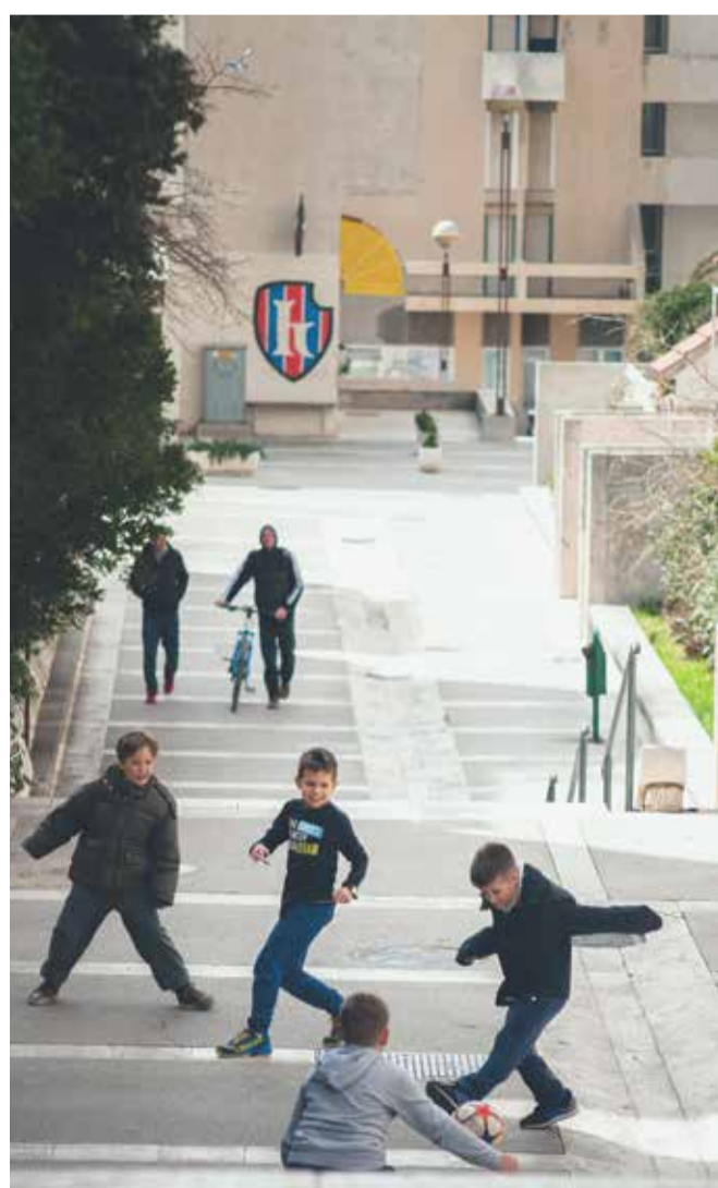
Ulični život na Trsteniku

Odluke unutar Projektna grupe Split 3 se donose na redovitim koordinacijskim sastancima. Vodeću ulogu imaju prisutni autori i s njima zajedno arhitekti - urbanisti, koji pored koordiniranja rada na projektima arhitekture rade i izvedbene projekte uređenja gradskog partera