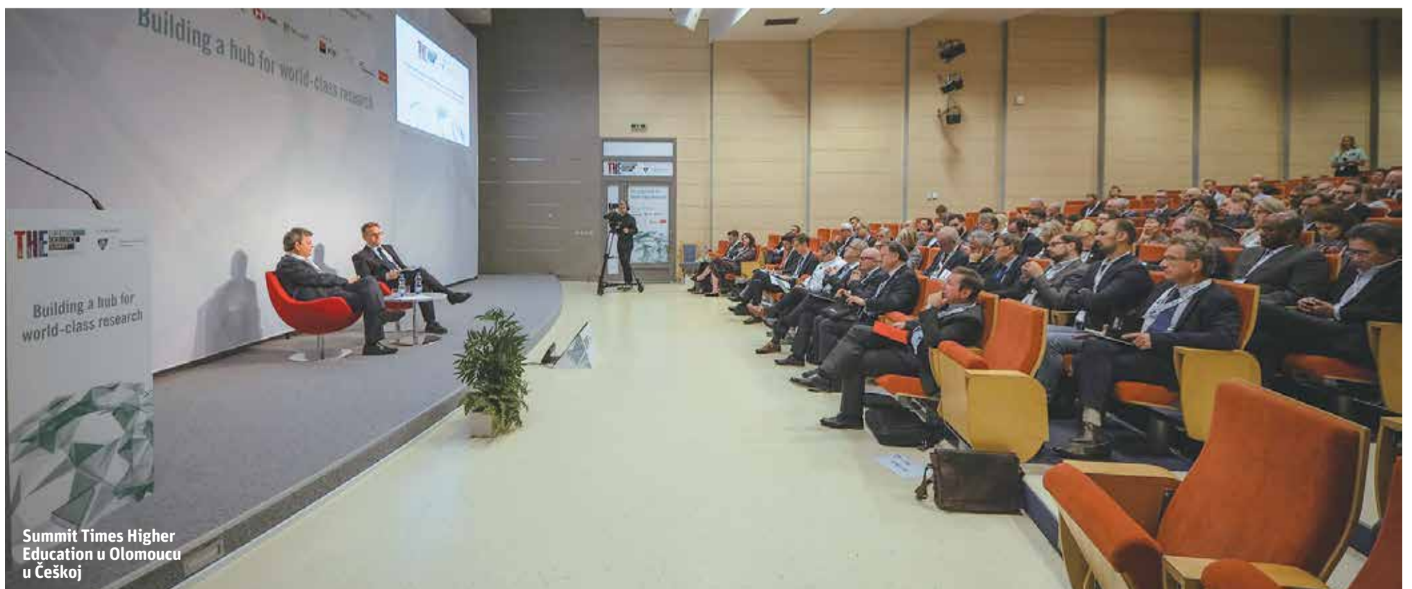
Summit Times Higher Education u Olomoucu u Češkoj

U konkurenciji za upravo objavljeni ranking sveučilišta nove Europe bila su sveučilišta iz Hrvatske, Bugarske, Cipra, Češke, Estonije, Latvije, Litve, Mađarske, Malte, Poljske, Rumunjske, Slovačke i Slovenije