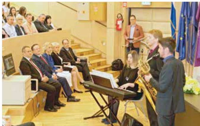
Studenti Muzičke akademije obogatili su svečanost