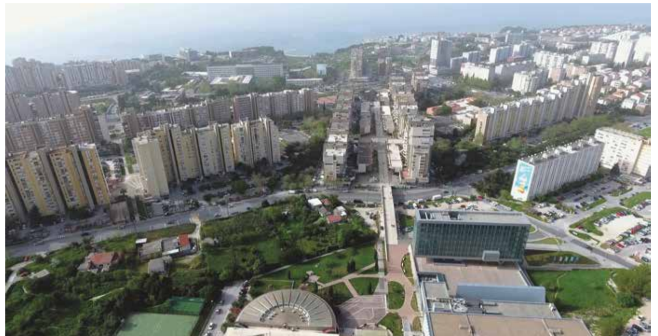
Panorama Splita 3 sa sveučilišnim kampusom

Okrugla obljetnica Splita 3 obilježava se do kraja lipnja manifestacijom na kojoj je prikazan ovaj jedinstveni urbanistički, arhitektonski i organizacijski pothvat stvaranja grada, uz osnovno pitanje: Što nam Split 3 znači danas i što iz njega možemo naučiti?