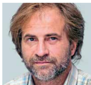
Branimir Hackenberger Kutuzović

Izabran je u znanstveno-nastavno zvanje redovitog profesora – trajno u području biomedicine i zdravstva, polje kliničke medicinske znanosti, grana interna medicina