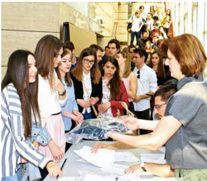
Red za potpise ugovora protezao se hodnicima

Sveučilište u Zagrebu ukupno jedodijelilo 500 stipendija za tekuću akademsku godinu, u četiri kategorije ovisne o uspjehu na studiju, programima, sudjelovanju u sportskim aktivnostima, te socio-ekonomskom statusu, a svaki student će u deset mjeseci primiti ukupno deset tisuća kuna