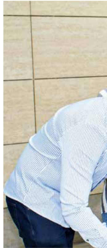
Potpisom je svaki stipendist "zar-

da će dobitnici stipendija i dalje biti jednako uspješni i dati značaj doprinos akademskoj zajednici, ali i društvu u cjelini.