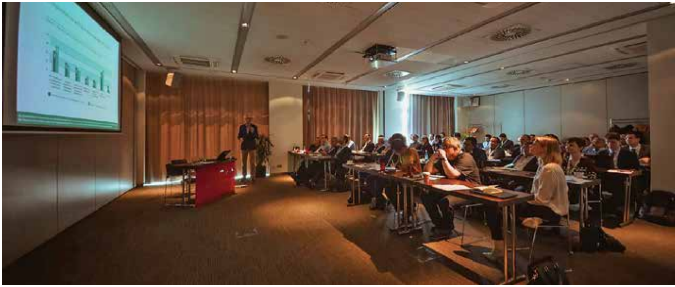
Kroz tri dana u Olomoucu se raspravljalo o sadašnjem trenutku znanosti i visokog obrazovanja