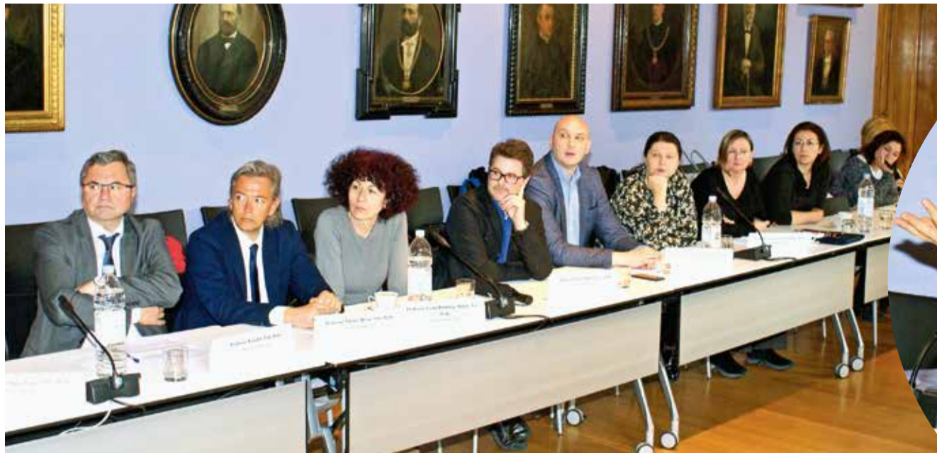
Predstavnicima sastavnica zagrebačkog sveučilišta dobili su informacije o suradnji s Velikom Britanijom