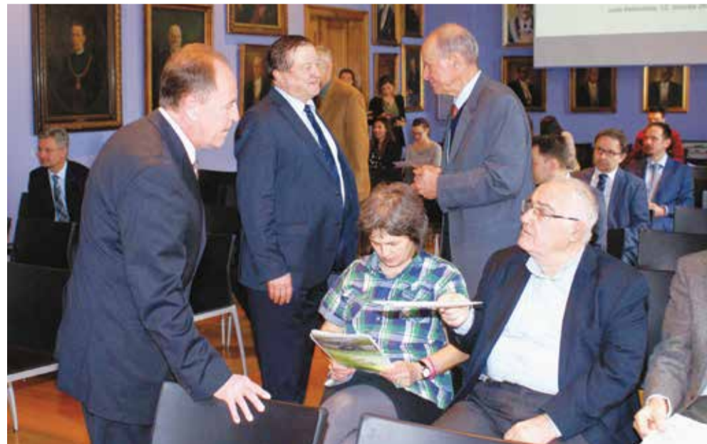
Tribine o transferu tehnologija i inovacijama na Zagrebačkom sveučilištu postale su tradicionalne