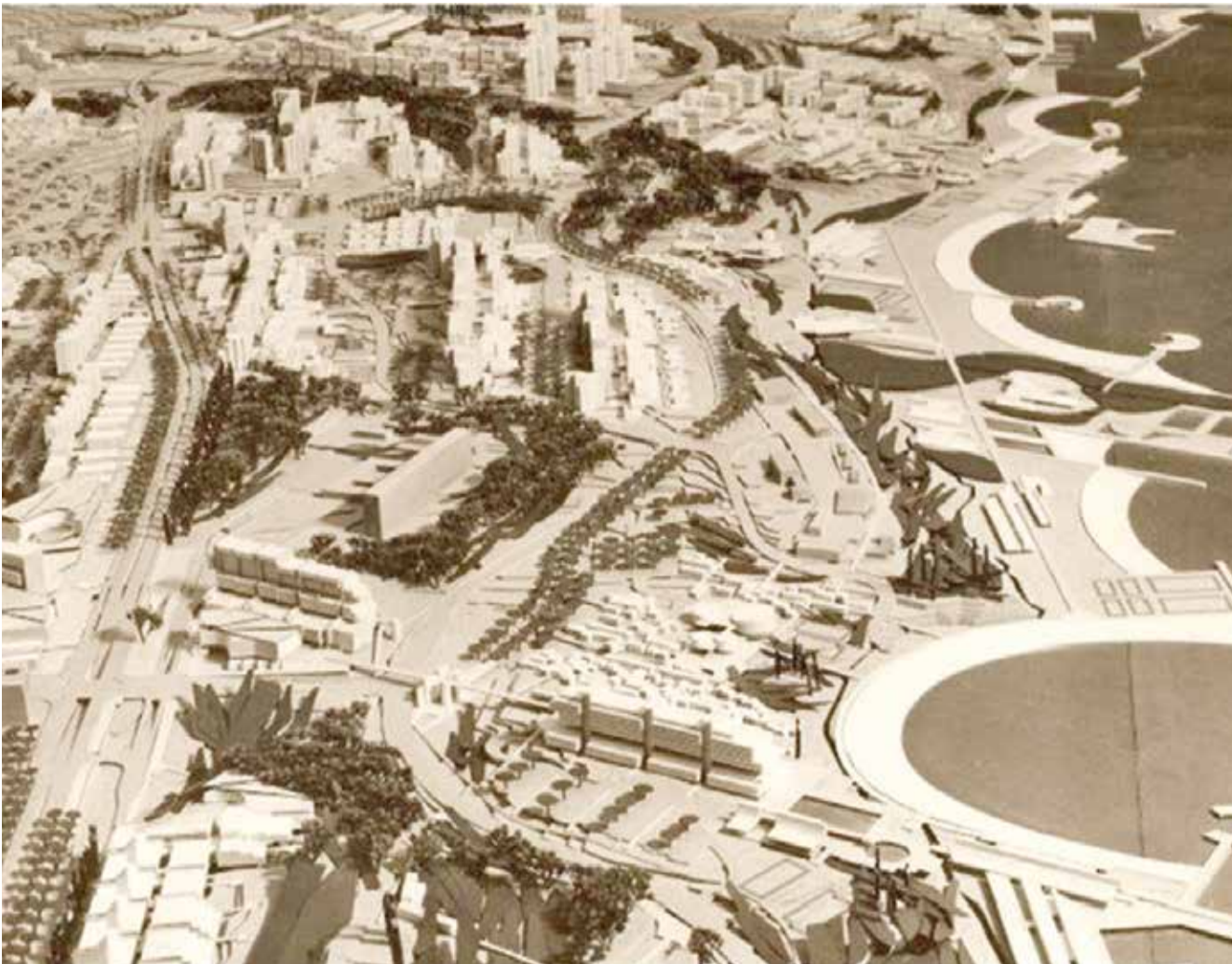
Izvorni projekt Splitska 3 izabran na natječaju