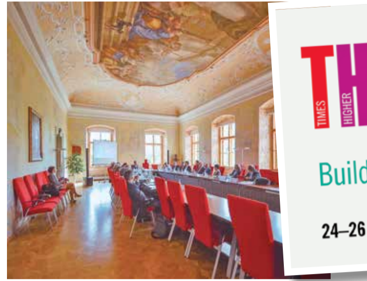
Sveučilište u Olomoucu osnovano je 1573.