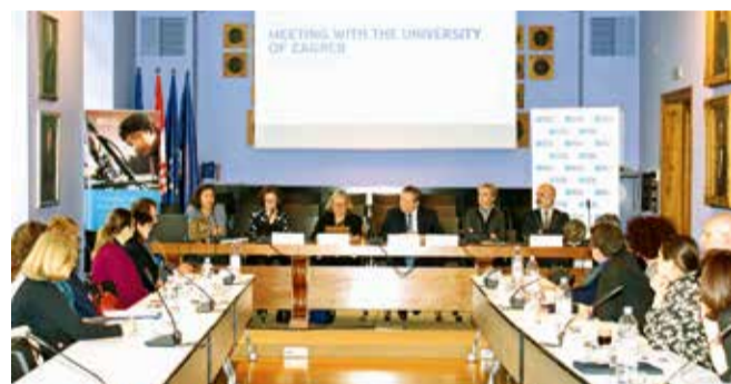
Predstavnicima Sveučilišta u Zagrebu i British Councila na skupu u rektoratu

Cilj sastanka bio je pružiti predstavnicima sveučilišta i sastavnica uvid u viziju i aktualne međunarodne prioritete britanskoga sektora visokoga obrazovanja, kao i pružiti gošćama priliku da se pobliže upoznaju s međunarodnim izazovima i prioritetima hrvatskoga visokoga obrazovanja