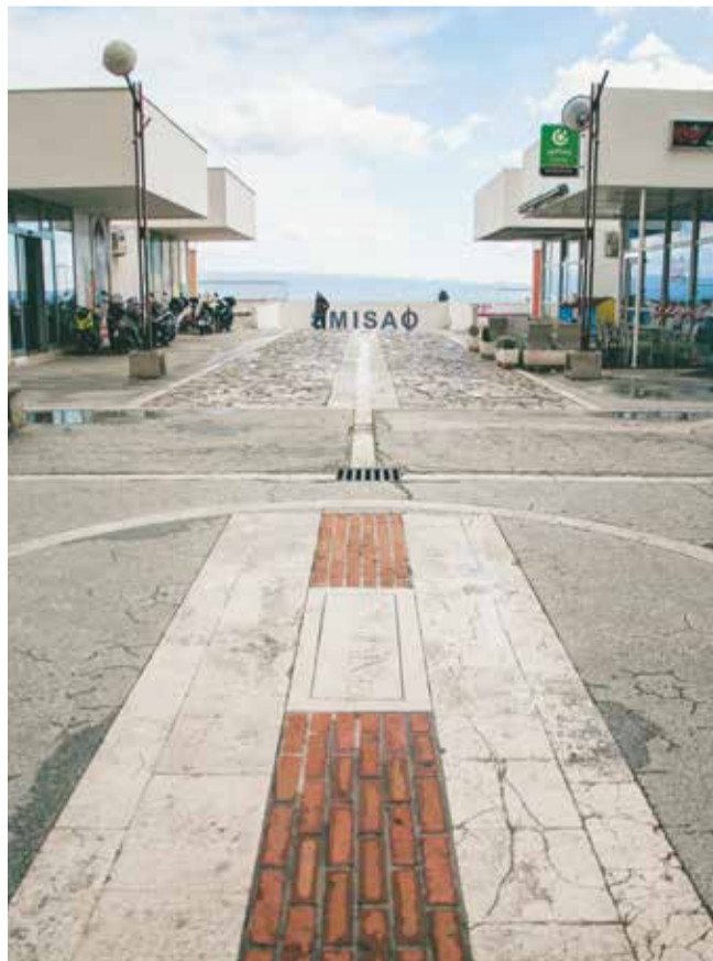
Centuriacija na Trsteniku