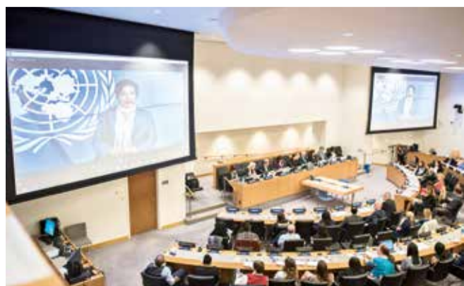
Konferencija o starenju i dugovječnosti u UN-u u New Yorku

Svjetske zdravstvene organizacije nego i autor još uvijek važeće definicije zdravlja i statuta Svjetske zdravstvene organizacije. Kao argument u prilog aktualnom značaju velikog hrvatskog liječnika, znanstvenika i promicatelja zdravstva, citirala je recentni uvodnik glavnoga urednika "Lanceta" Richarda Hortona o Andriji Štamparu.