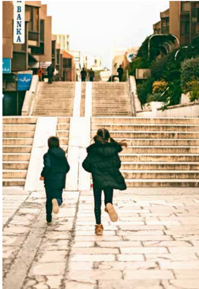
Ulica Ruđera Boškovića, nekad poznata kao Sveučilišna

POLA STOLJEĆA URBANISTIČKOG PROJEKTA KOJI JE IZMIJENIO IZGLED GRADA POD MARJANOM