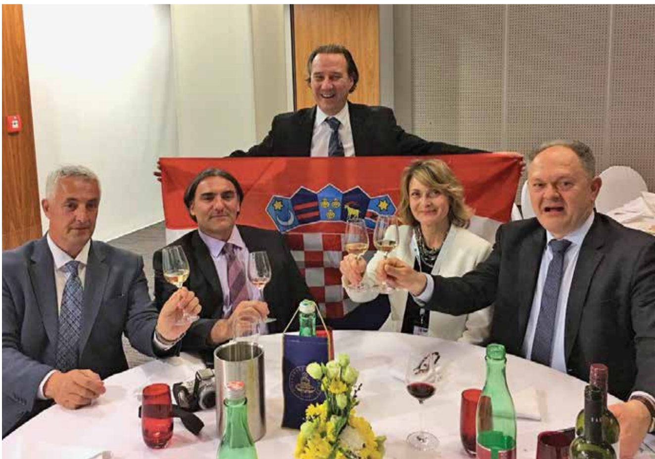
Čelnici Splitskog sveučilišta s veleposlanicom Ines Troha

nova destinacija za svjetske znanstvene talente", pa je to više šteta što u Češkoj nije bilo predstavnika obrazovnih vlasti.