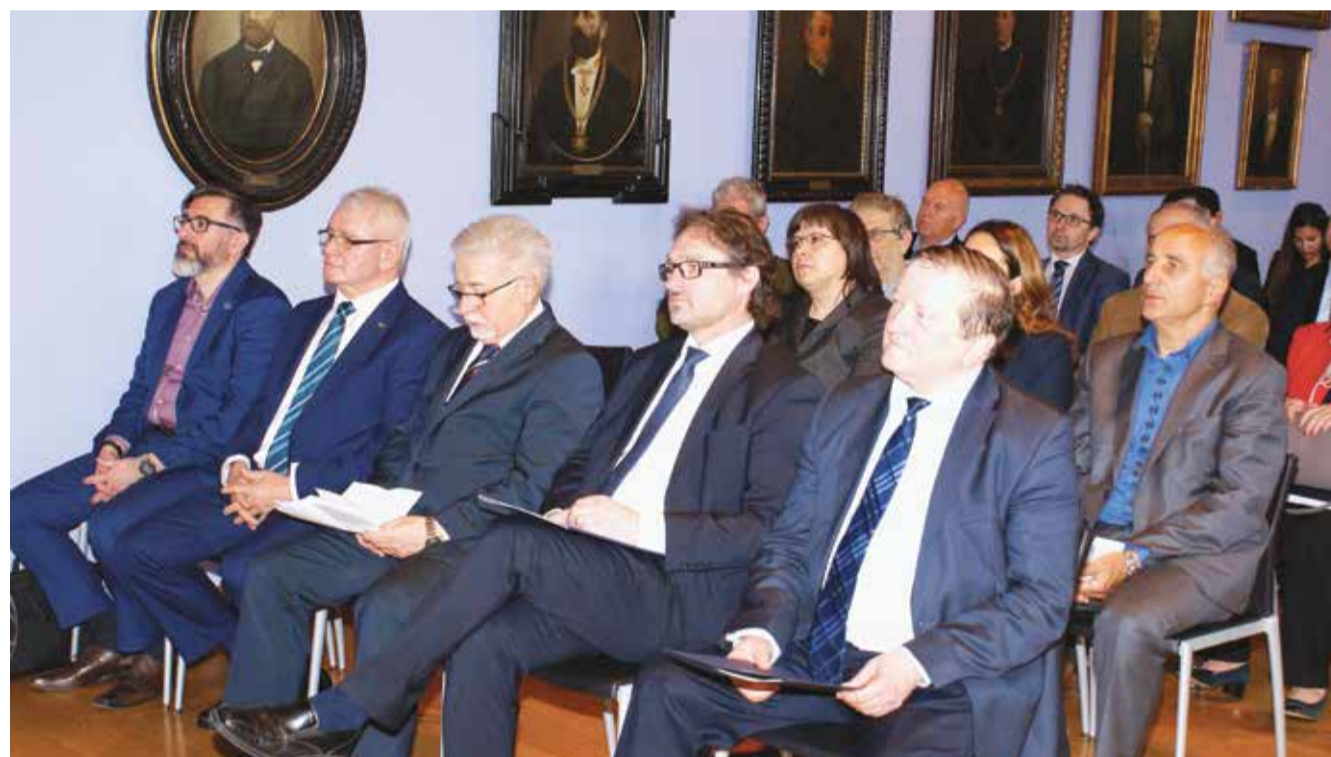
Tribina o suradnji Sveučilišta u Zagrebu i tvrtke Tehnix

Tribinom je predstavljena dobra praksa suradnje znanosti i visokog obrazovanja s gospodarstvom u području razvoja procesa kompostiranja biorazgradiva komunalnoga otpada između Fakulteta kemijskog inženjerstva i tehnologije Sveučilišta u Zagrebu i tvrtke Tehnix, vodeće u eko-industriji u Hrvatskoj i Europi te inovacijskog lidera