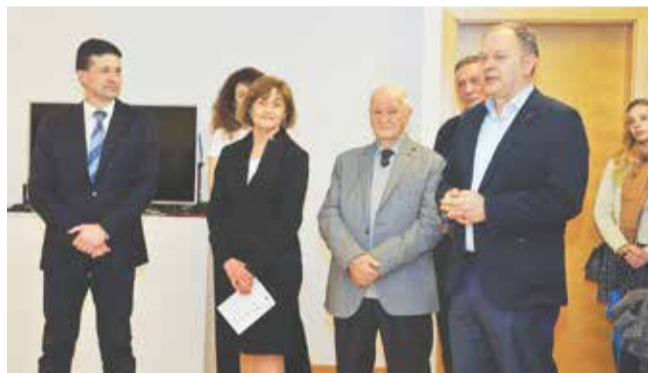
Otvaranje izložbe o Splitska 3 u Sveučilišnoj knjižnici

Objedinjavanjem kompleksne i raznovrsne građe Splitska 3, njezinim razvrstavanjem i formiranjem lako razumljive cjeline, željeli smo posjetiteljima približiti Split 3 kao primjer uspješnog suvremenog planiranja grada i potaknuti kritičko promišljanje doprinosa Splitska 3 dosadašnjem i budućem planiranju razvoja Splitske i drugih manjih gradova.